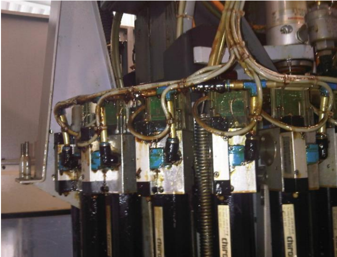
Die mit Öl verschmutzten Werkzeuggreifer erfordern eine besonders schonende Reinigung

Als Medium wird der maschineneigene Kühlschmierstoff verwendet. Somit wird die Emulsion nicht verwässert, es werden keine Fremdstoffe eingetragen. Der KSS kann in den Tank des Heißreinigungs-Geräts eingefüllt oder direkt aus dem Tank der Werkzeugmaschine angesaugt werden. Schneidöl kann in den Tank des Heißreinigungs-Geräts gefüllt werden.