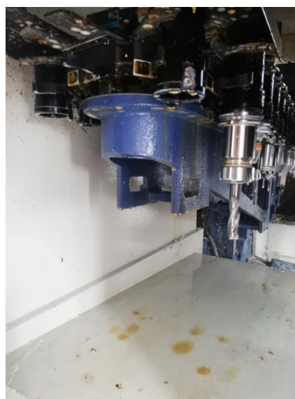
Werkzeugmagazin – vorher - nacher

Eine Reinigung mit Hochdruck scheidet per se aus, da die hohen Drücke und Wassermengen zum Ausspülen der Lager, zu Beschädigungen an Kabeln, Schläuchen und Sensorik, sowie zu Rostbildung führen würden. Der Einsatz von Lumpen und Bürsten wiederum ist nur da möglich, wo man hinkommt und birgt neben der unzureichenden Reinigung