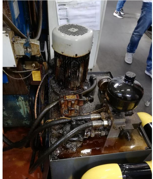
Auch stark verschmutzte KSS-Pumpen lassen sich mit Niederdruck-Heißreinigung und dem eigenen KSS problemlos abreinigen