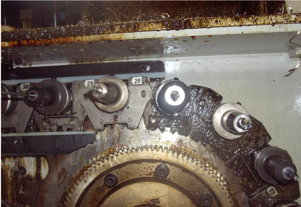
Kette und Werkzeugaufnahme im Werkzeugmagazin teilweise gereinigt