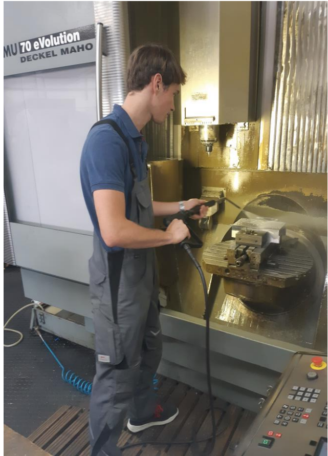
Reinigung mit Niederdruck-Heißreinigungstechnik Werkzeugmaschine mit Schwenktisch