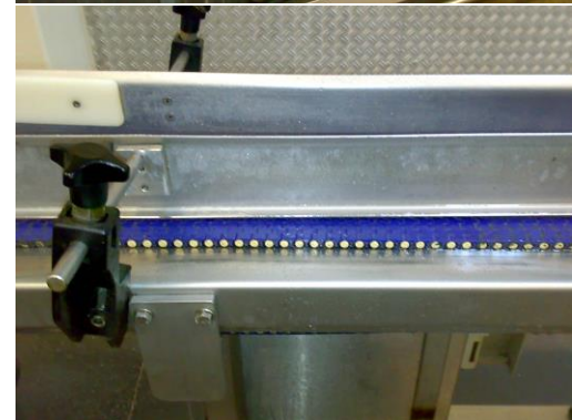
Abreinigen eines Förderbandes: Vorher, während und nach der Reinigung mit Niederdruck-Heißreinigungsverfahren