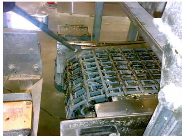
Förderbänder: Links - mit Resten von Lebkuchen und Karamell, rechts – mit Sesamöl bei der Reinigung