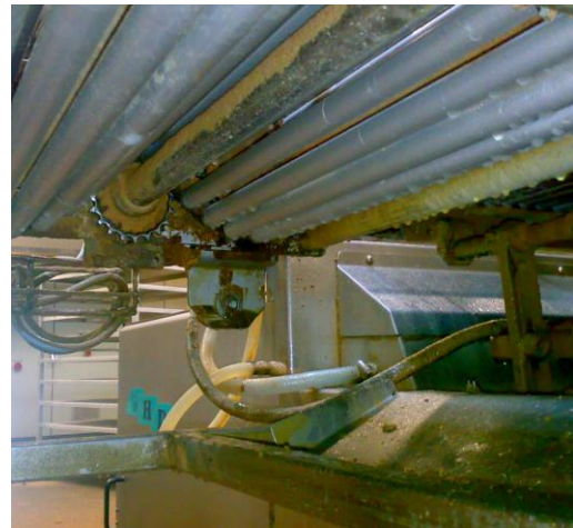
Förderband, Unterseite, mit fettigen Verschmutzungen, teilweise gereinigt