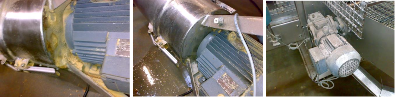
Elektromotoren: Links Zylinder ungereinigt, Mitte Zylinder gereinigt; rechts mit Mehlstaub verklebt