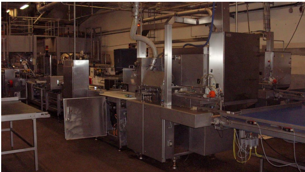
Brottschneid- und Packanlage für Schnittware: Belegt mit Speiseölen und Brotkrumen. Bisher gereinigt mit Druckluft und Lappen.