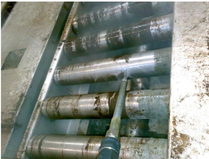
Reinigung Förderband mit Niederdruck-Heißreinigungsverfahren: Schonend, umweltfreundlich, und hoch effizient. Deutlich erkennbar die bereits gereinigten Zonen an der mittleren Rolle.