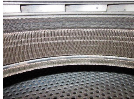
Teil eines Flugzeuggetriebes von GE, Titan, mit besonders feinen Löchern